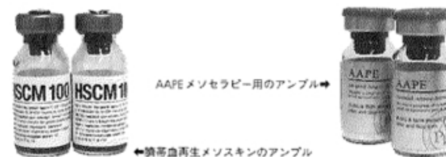
Chapter 2 美肌・エイジングケア

前ページのリジュランと同じように、高度なエイジングケア成分を直接肌に注入する施術。血液疾患に用いられている臍帯血の培養液や多種の成長因子を、注射で注入していく。高い皮膚再生効果で薄くなった肌に厚みが出て弾力も高まり、小ジワやたるみを改善。さらにシミやニキビ跡の凹みのケアなど、マルチな美肌効果が期待できる。施術は麻酔クリームを塗ったあと、手で細かく注入していくので所要時間は30分前後。直後は赤みがあるが、ダウンタイムはほとんどない。