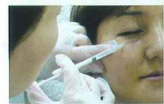
隊長は打たれていることにすら気づかない。見ているほうが痛い。