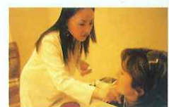
麻酔のクリームを顔面に。これで注射の痛みは感じなくなる。