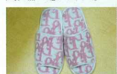
女性ならではのこだわりが随所に。ティオールのスリッパも然り。