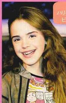
2003 「ハリポタ2」の ビデオ発売のとき