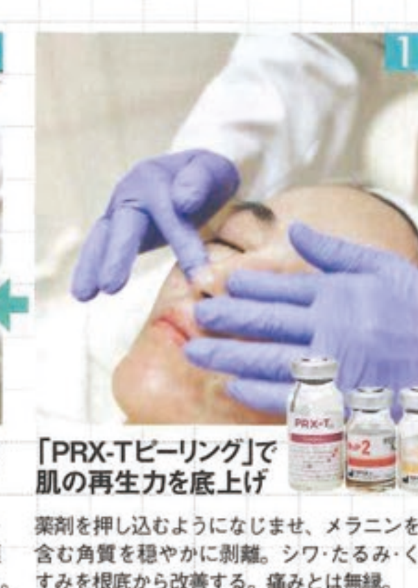
「PRX-Tピーリング」で肌の再生力を底上げ 薬剤を押し込むようになじませ、メラニンを含む角質を穏やかに剥離。シワ・たるみ・くすみを根底から改善する。痛みとは無縁。