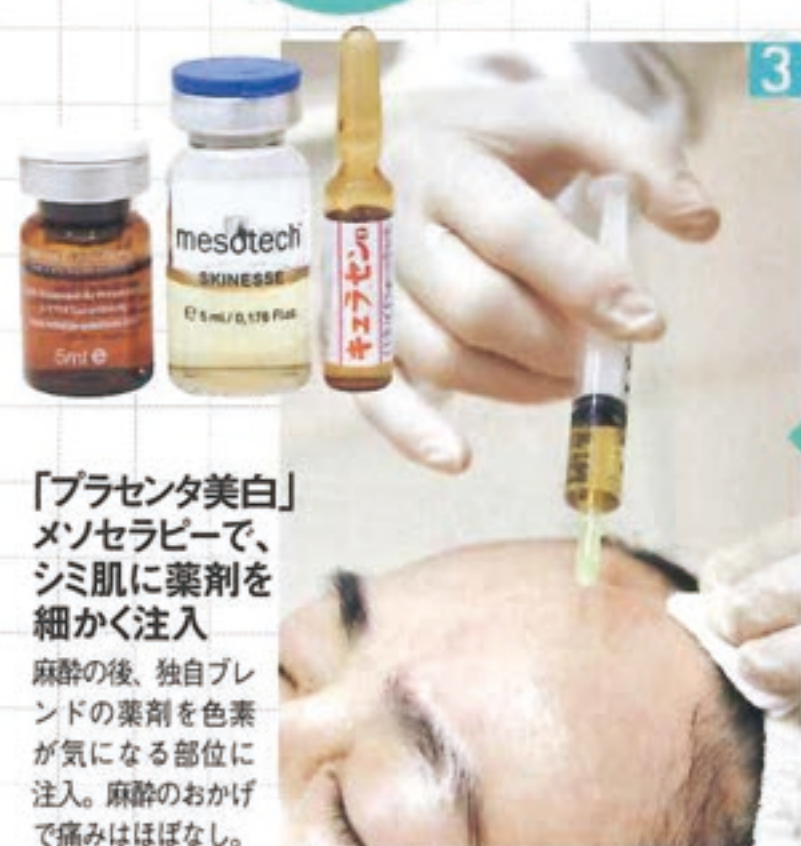
「プラセンタ美白」メソセラピーで、シミ肌に薬剤を細かく注入 麻酔の後、独自ブレンドの薬剤を色素が気になる部位に注入。麻酔のおかげで痛みはほぼなし。